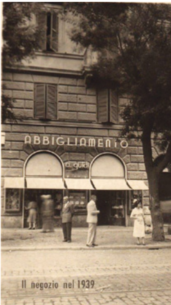
Il negozio nel 1939