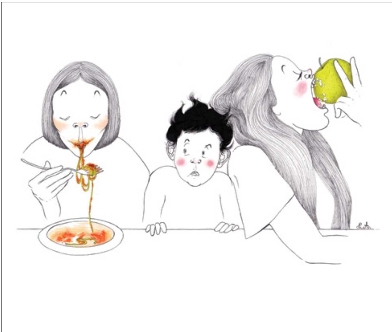
Illustrazione di Chiara Armezzani

Un progresso in gran parte dovuto a quando, da bambino, andavo a pranzo a casa di amici con famiglie numerose. I piatti sbattevano sui lavabo, le nonne gridavano «E' pronto!» mentre il coltello affilato sezionava graffiando fette sbilenche di pane sbuffanti di farina. La carne sbattuta a mano sembrava