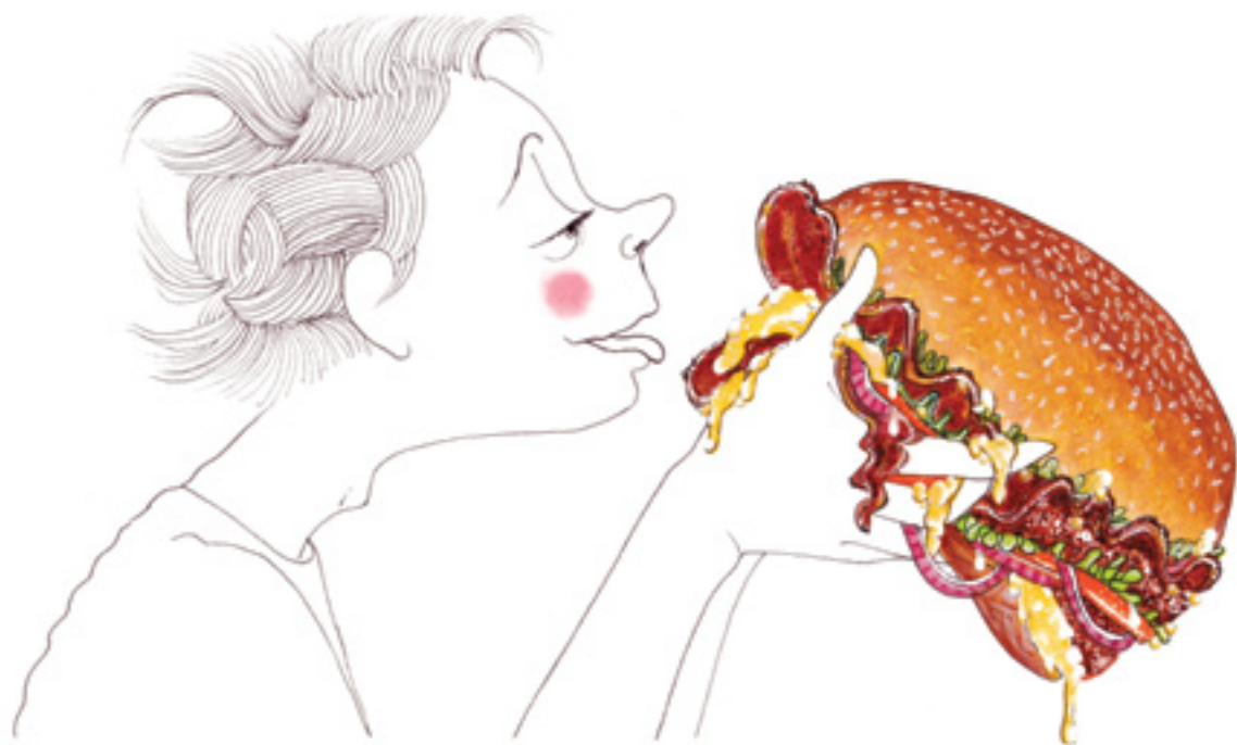
Illustrazione di Chiara Armezzani